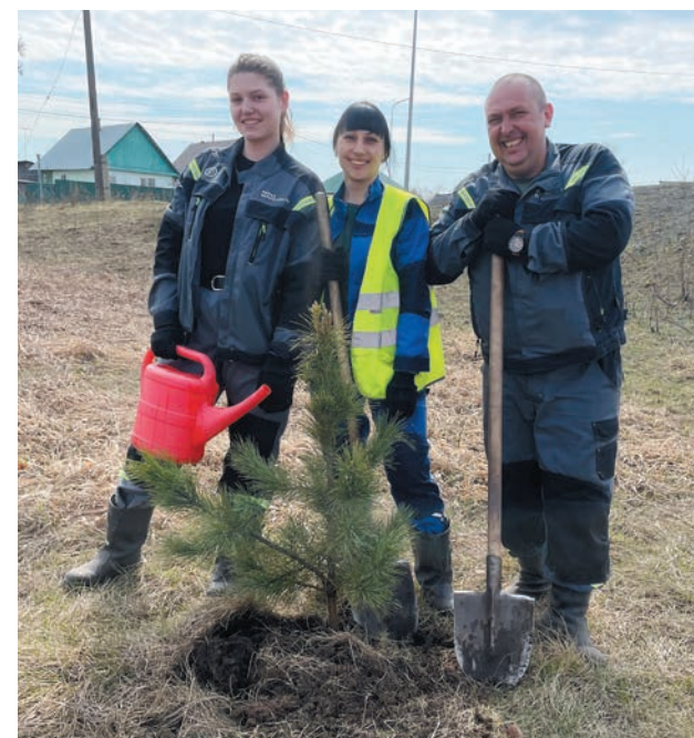
Сотрудники «Разреза Верхнетешского» впервые приняли участие в озеленении Новокузнецкого района