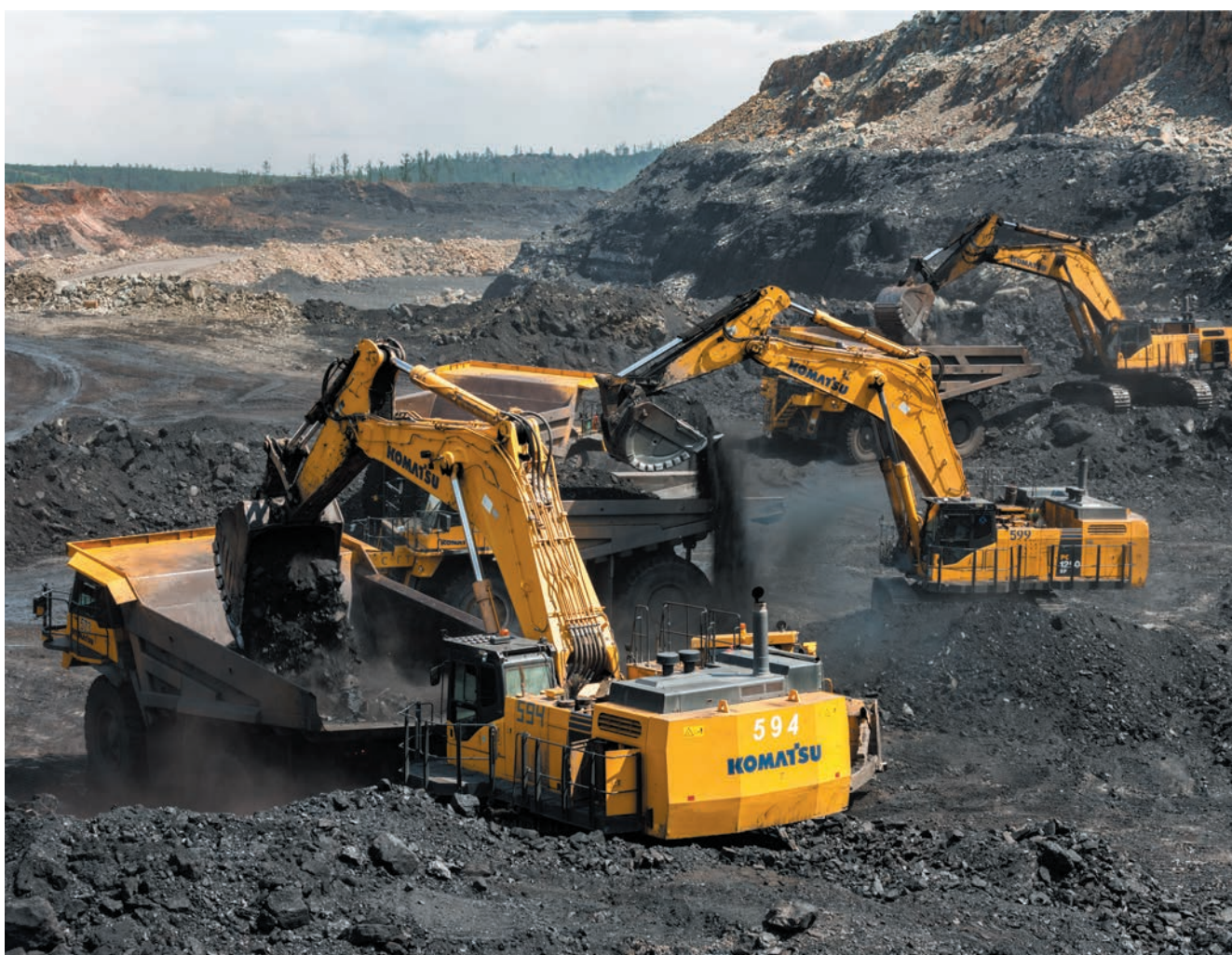
Проектные решения дают доступ к новым рабочим горизонтам разреза

В АПРЕЛЕ 2023 ГОДА ГЛАВГОСЭКСПЕРТИЗА РОССИИ (ГГЭ) СОГЛАСОВАЛА ПРОЕКТНУЮ ДОКУМЕНТАЦИЮ И РЕЗУЛЬТАТЫ ИНЖЕНЕРНЫХ ИЗЫСКАНИЙ НА СТРОИТЕЛЬСТВО ВТОРОЙ ОЧЕРЕДИ ЭЛЬГИНСКОГО МЕСТОРОЖДЕНИЯ МОЩНОСТЬЮ 45 МЛН ТОНН В ГОД