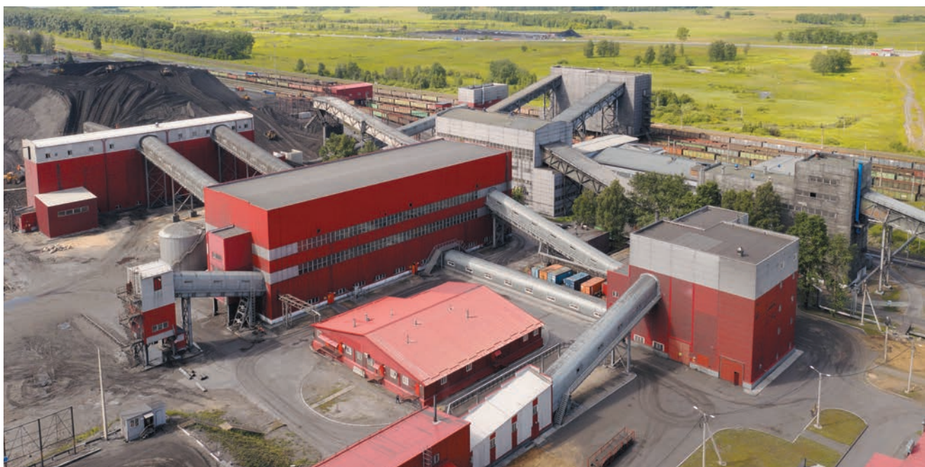
Обогатительные фабрики «Листвянская-2» и «Листвянская-1»