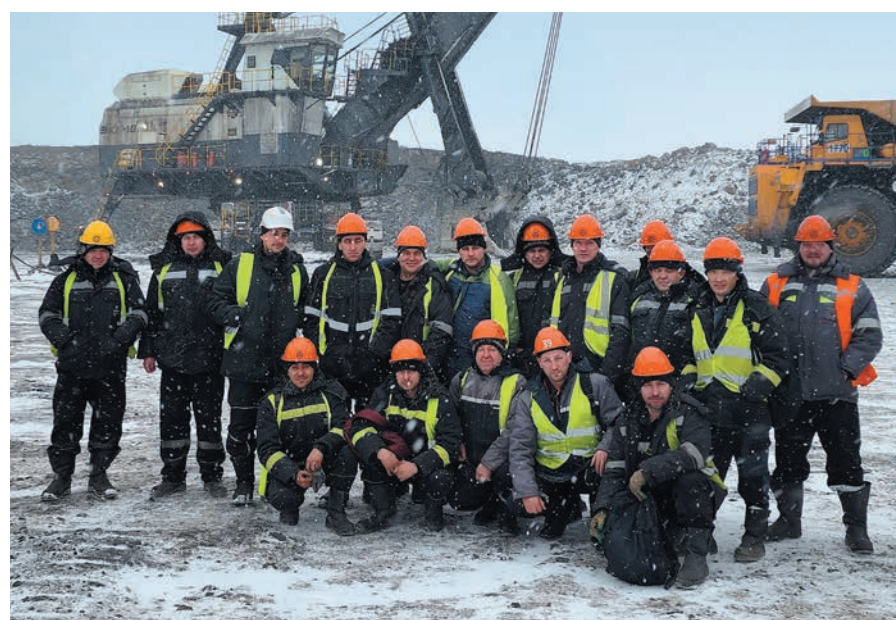
Творцы исторического достижения – бригада ЭКГ-18Р № 9