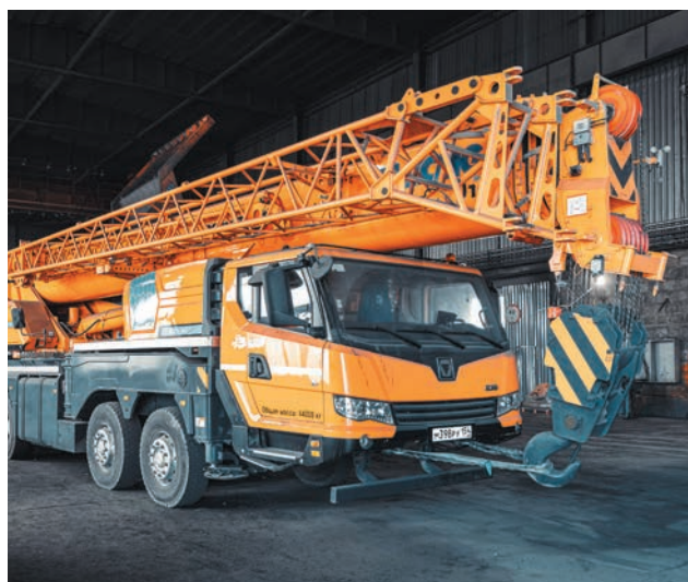
Новый подъемный край готовится к сборке карьерной техники

ДВА НАШИХ ГЛАВНЫХ БОГАТСТВА – «ЧЕРНОЕ ЗОЛОТО» И ЛЮДИ, И ПРИУМНОЖЕНИЕ ПЕРВОГО НЕВОЗМОЖНО БЕЗ ВТОРОГО