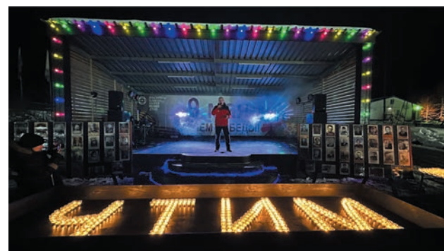
Послание героям

Завершилось мероприятие красивой акцией «Свеча памяти». Слово «Чтим» выложили из свечей как память о погибших ради жизни будущих поколений. Более тысячи огней зажглись в этот вечер на Эльге в знак памяти о событиях 1941-1945 гг.