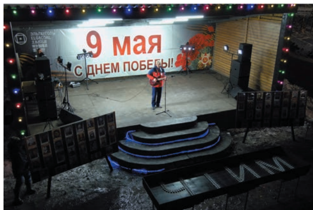
Песни победы