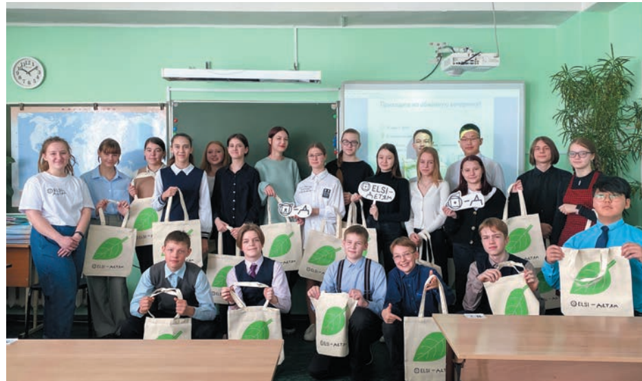
Удачный старт

Самые яркие инициативы, отзывы детей, фотоотчеты найдут отражение на страницах ELSI LIFE. Мы обязательно будем делиться с вами историей развития проекта.