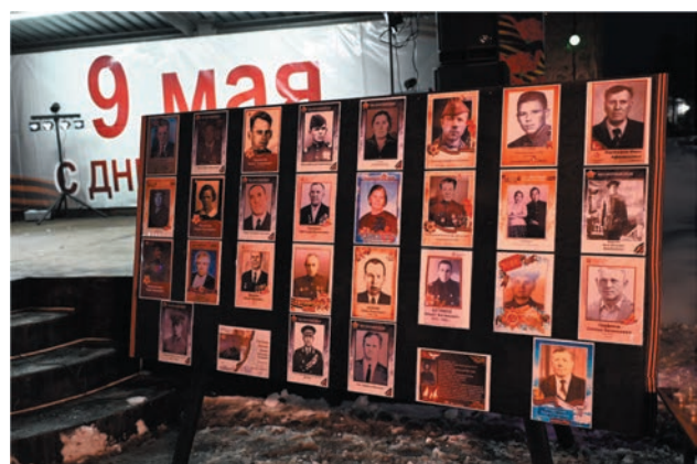
Бессмертный полк замер