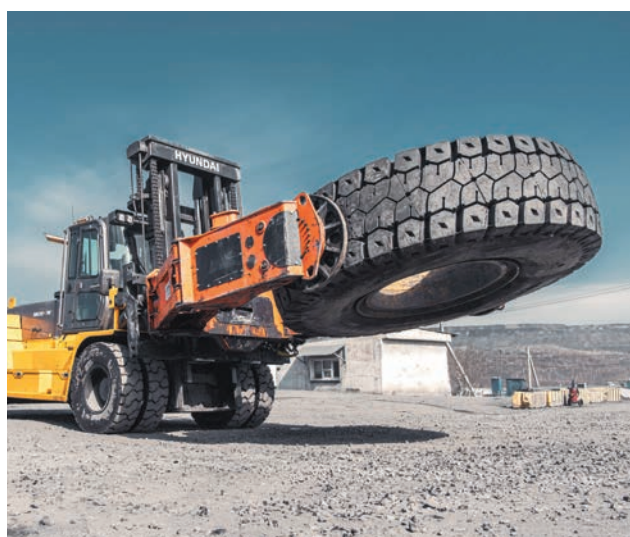
Шиномонтажный погрузчик всегда в деле