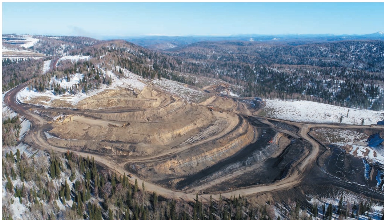
«Разрез Верхнетешский» развивается уверенным темпом

К концу прошлого года «Разрез Верхнетешский» добыл первые 100 тысяч тонн угля. Для начинающего предприятия цифра впечатляющая. Сейчас этот показатель «перевалил» за 250 тысяч тонн – в феврале план по добыче перевыполнен на 125%, в марте предприятие также «шагало» с опережением. При этом уголь стабильно высокого качества. Доля высококачественных углей (с золой до 11%) составляет 40-50% в общем объеме добычи. Работникам