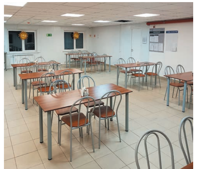
В новой столовой светло и комфортно

Для работы привлечены два повара, повар-кассир, кухонный рабочий и уборщик. Установлено все необходимое оборудование: 4-х комфорочная электрическая плита, жарочная печь, электрическая сковородка, два морозильных ларя и три холодильника.