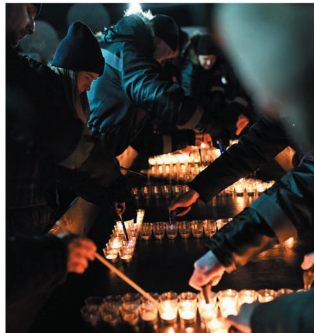
Светлая память героям